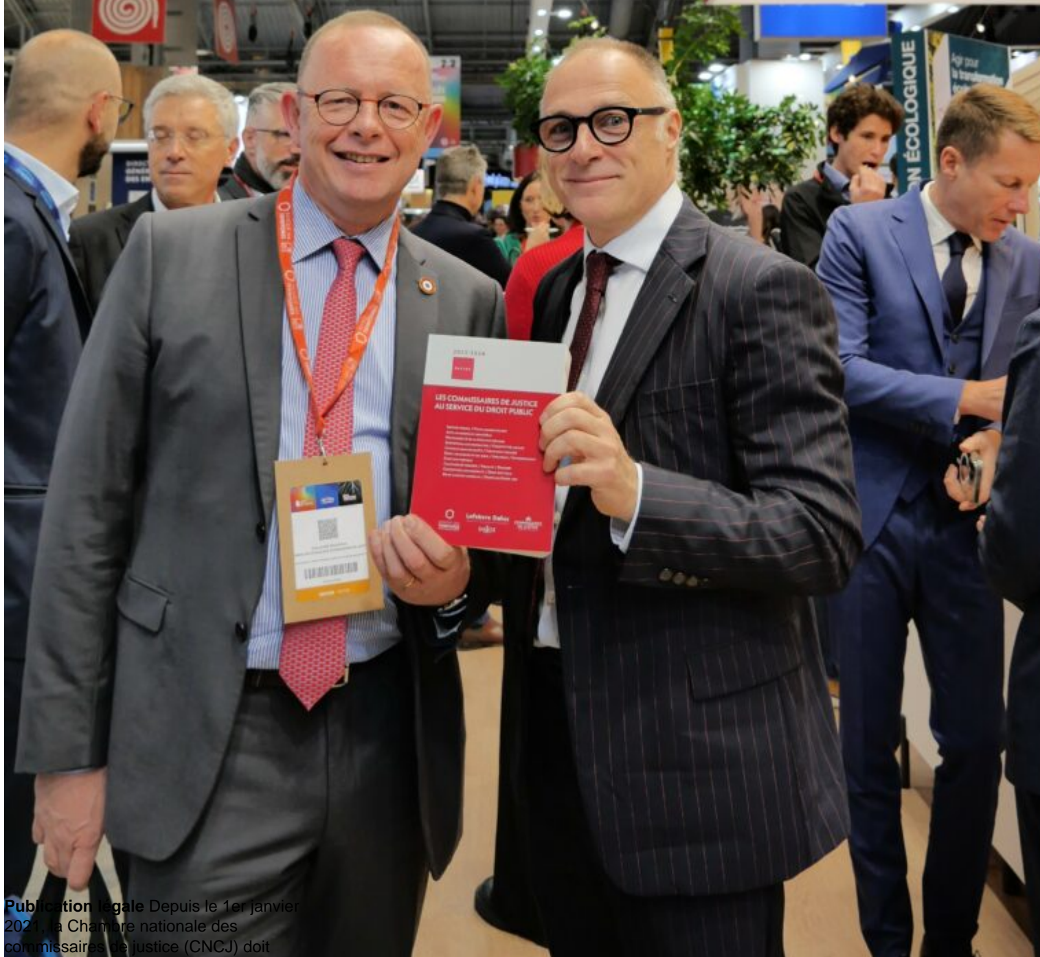
Publication légale Depuis le 1er janvier 2021, la Chambre nationale des commissaires de justice (CNCJ) doit assurer la publicité de certains mouvements impactant les offices qui ne font plus l'objet d'un arrêté du garde des Sceaux (art. 7-1 D. 2018-872 du 9 octobre 2018)